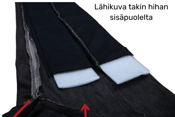
Lähikuva takin hihan sisäpuolelta

Takin kaulus ja kämmenten alueiden resorit antavat kevyempää suojaa.